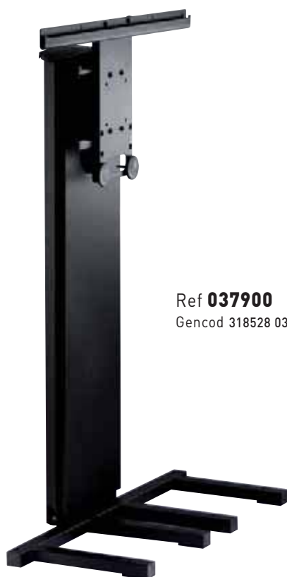
Ref 037900 Gencod 318528 037900 2