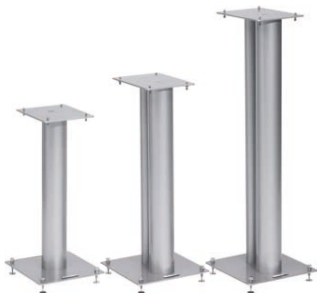
Stylum I Stylum II Stylum III

Extrêmement rigides, ces pieds contribuent très efficacement à l'amélioration des graves des enceintes.