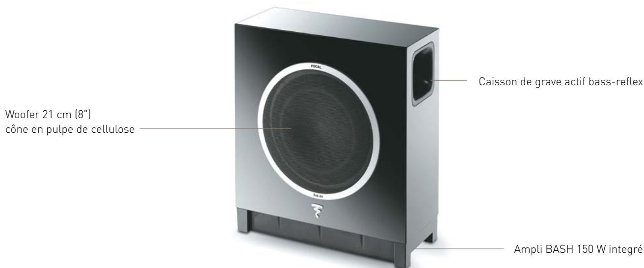
Sub Air, finition haute brillance.

Le son intense et profond du Sub Air accompagnera tous les systèmes 5.1 Focal. Il est sans fil pour une plus grande liberté d'intégration : plus de contrainte liée à la longueur du câble. Plat et compact, il se glisse et s'intègre dans tous les espaces. Facile à installer, facile à utiliser : il se réveille seul quand vous le lui demandez et s'éteint automatiquement lorsqu'il n'y a plus de son.